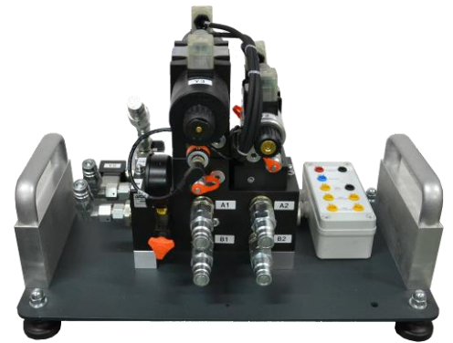
Platine de commande hydraulique

COMPACTICC est un sous ensemble issu de la presse à briquettes BRIQUETICC . Il comprend des fonctions électromécaniques et hydrauliques concourant au compactage de broyats et donc à la fabrication de briquettes.